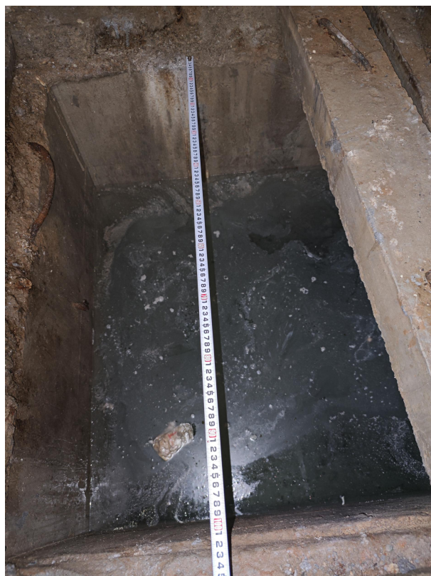
图 5: 集水坑尺寸 2 (宽 1 米)