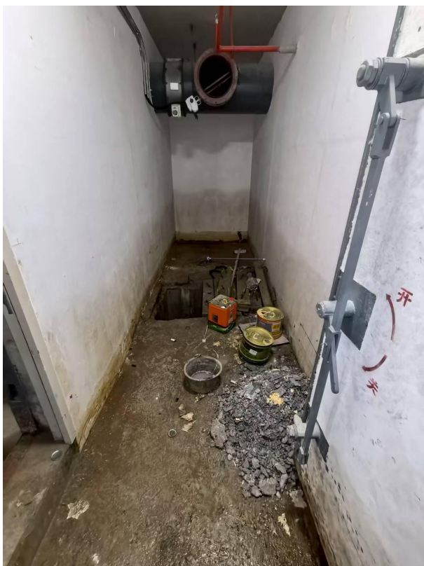
图 2: 事故洗消间内部照片