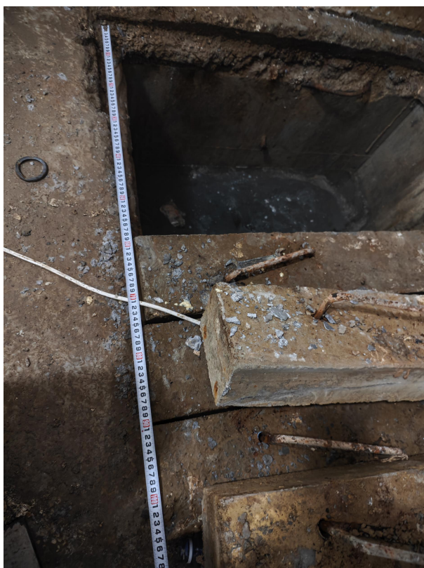
图 4: 集水坑尺寸 1 (总长 1 米, 开口 0.6 米)