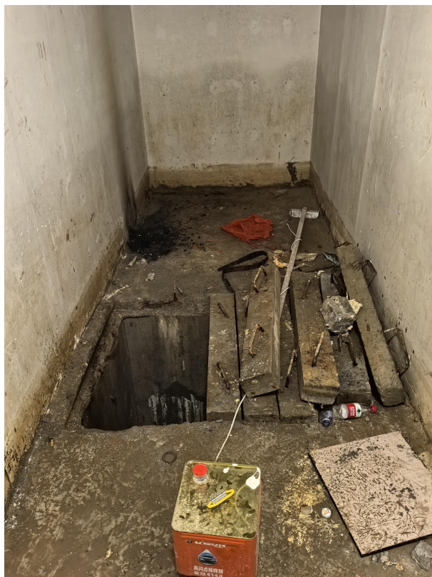
图 3: 事故集水坑整体照片